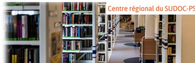
Centre régional du SUDOC-PS

Dans le cadre du SUDOC, le réseau SUDOC-PS (pour Publications en série) a la charge du signalement des publications en série : il décrit les collections de revues et journaux de différents établissements documentaires, universitaires ET hors Enseignement supérieur, publics ou privés. Il est organisé en centres régionaux des périodiques.